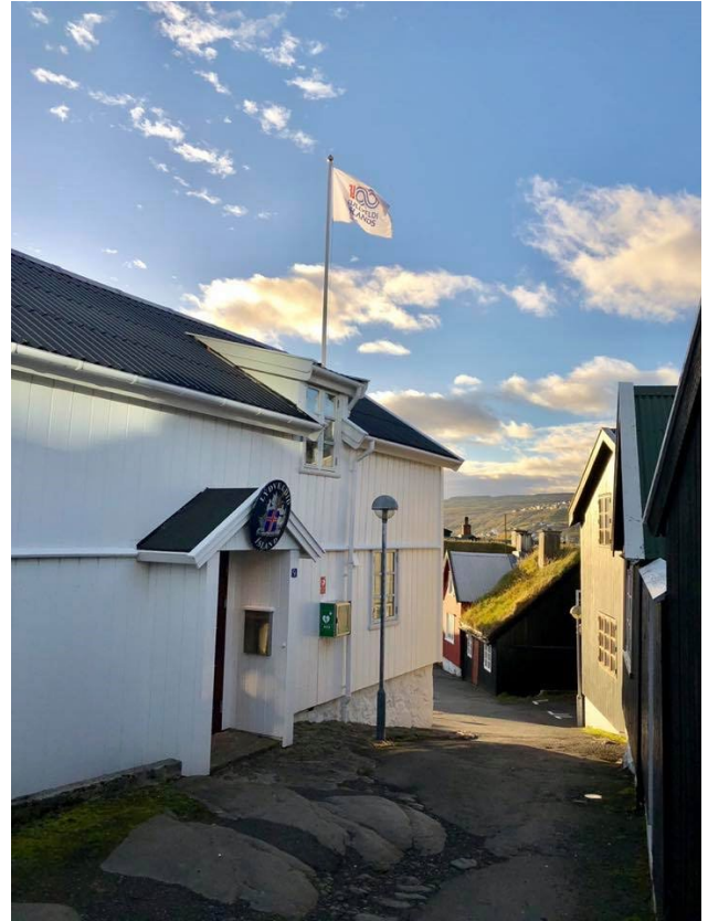
Mynd 1: Aðalræðisskrifstofa Íslands í Þórshöfn.

Allt frá landnámi norrænna manna á Íslandi og í Færeyjum hefur almenningur litið til skyldleika, vináttu og sameiginlegrar sögu. Með breyttum þjóðfélagsháttum, betri samgöngum, aukinni tækni á sviði samskipta almenning og atvinnulífs eru allar forsendur til aukinnar samvinnu á grundvelli gagnkvæmra hagsmuna og fjölmörgum sviðum mannlífs og atvinnulífs. Breytt heimsmynd og breytt samstarf þjóða í norðurhögum kallar á aukið samstarf í umhverfis- og auðlindamálum svo dæmi séu nefnd. Á grunni sameiginlegrar sögu, frændsemi, sameiginlegra hagsmuna og aldalangrar vináttu eru góðar forsendur fyrir farsælu og auknu samstarfi um ókomna tíð.