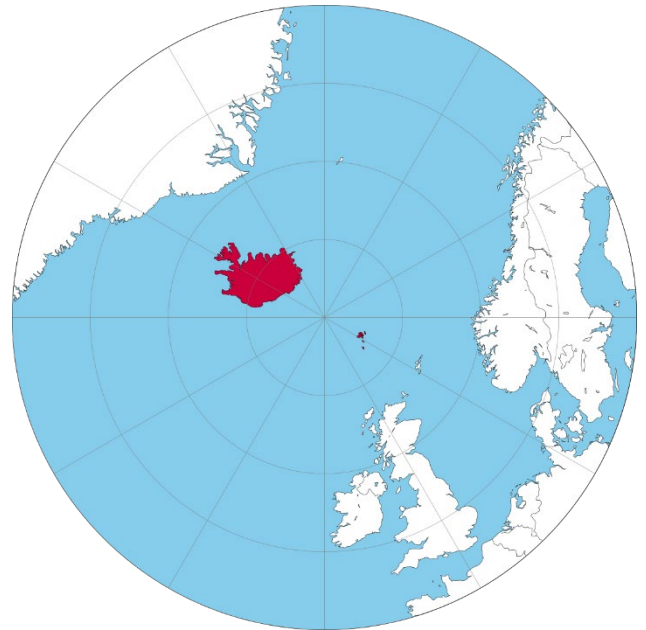
Mynd 5: Nærumhverfi Íslands og Færeyja.

Það er ekki fyrr en á 19. öld sem Færeyingar reyndu að taka málin í eigin hendur en fyrr eru nefndar tilraunir Nólsoyjar Páls að hefja siglingar frá Færeyjum til annarra landa. Það er ekki fyrr en í lok 19. aldar sem fiskiskipastóll Íslendinga og Færeyinga fer vaxandi og í raun ekki fyrr en í byrjun 20. aldar sem vélknúnir togarar gera siglingar milli landanna auðveldari. Með stofnun skipafélaga á árunum 1914 til 1920 hefjast vöruflutningar á sjó í löndunum með tilkomu skipafélaga í eigu Íslendinga og Færeyinga. Þróunin síðustu ár hefur verið jákvæð með auknum siglingum og bættum flugsamgöngum. Flutninganet Íslendinga á sjó og í lofti er mjög umfangsmikið og í því fólgin veruleg þjóðhagsleg verðmæti þar sem tækifæri til viðskipta, menningar og annarrar starfsemi fylgja hverri viðkomustöð skipa og flugvéla.