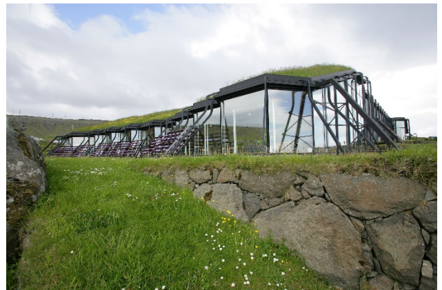
Mynd 8: Norðurlandahúsið í Þórshöfn.

Á síðustu áratugum hefur töluvert af íslenskum leikstjórum komið til Færeyja til að leikstýra, bæði atvinnu- og áhugamannafélögum víðsvegar um eyjarnar og eins boðið upp á vinnustofur af ýmsum gerðum. Eins hafa Íslenskir leikmyndahönnuðir, ljósamenn o.fl. lagt færeyskum sviðslistaverkefnum lið. Þetta gerist þó yfirleitt vegna persónulegra tengsla manna í millum. Oft hafa stór sviðslistaverkefni sem styrkt hafa verið af norrænum sjóðum, t.a.m. Veislan eftir Thomas Vinterberg, sem sett var upp í Norðurlandahúsinu í Þórshöfn verið upphaf tengslamyndunar sviðslistafólks frá Færeyjum og Íslandi – og þau tengsl síðan getið af sér fleiri verkefni. Eins hafa nokkrir Færeyingar sótt sér menntun innan sviðslista á Íslandi og þannig komið upp öflugum tengslaneti.