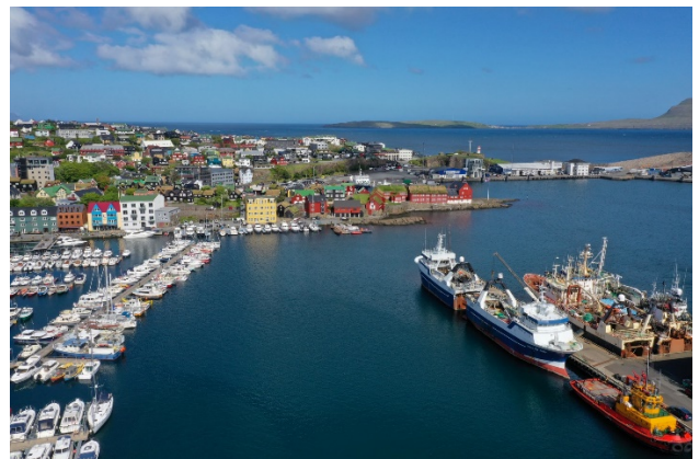
Mynd 2: Frá höfninni í Þórshöfn.

Færeyjar skipa sérstakan sess sem markaður fyrir útfluttar neytendaafurðir og ýmsan iðnaðarvarning. Sem dæmi má nefna að Færeyjar hafa um langa hríð verið mikilvægur markaður fyrir íslenskt lambakjöt, en einnig eru fluttar út unnar kjötvörur, mjólkurafurðir, tilbúnar fiskafurðir og umbúðir fyrir sjávarútvegsfyrirtæki. Athyglisvert er að áhugi er á að auka útflutning á hvers kyns fersku grænmeti til Færeyja sem ætti að vera hagkvæmt í ljósi fjölbreyttrar framleiðslu á Íslandi og hagstæðum flutningatíma til Færeyja. Vegna nálægðar Færeyja og Íslands og vegna þess hversu líkur færeyski neytendamarkaðurinn er þeim íslenska, er á vissan hátt hægt að segja að hann sé framhald af heimamarkaði íslenskra fyrirtækja. Útflutningur Færeyinga til Íslands hefur verið nokkuð sveiflukennður í gegnum árin.