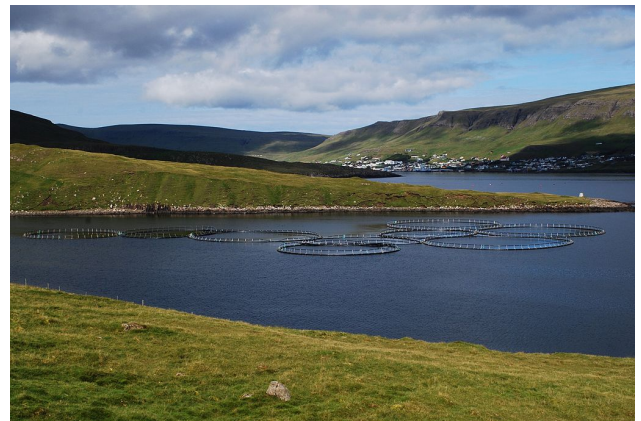
Mynd 6: Fiskeldiskvíar úti fyrir Suðurey.

Forsenda fiskeldis í Færeyjum og á Íslandi er að fyrirtæki sem hyggjast hefja eldi á fiski þurfa til þess leyfi viðkomandi stofnana sem fara með þau mál. Á Íslandi þarf að tilkynna Skipulagsstofnun ef áform eru um eldi á yfir 200 tonnum af fiski á ári. Í framhaldi er tekin ákvörðun um matskyldu verkefnisins,