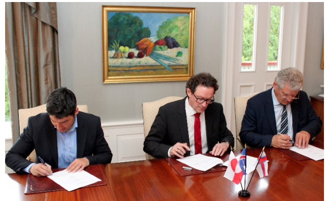
Mynd 7: Frá undirritun samsstarfssamnings Íslands, Færeyja og Grænlands um heilbrigðismál.

Í gildi er samningur milli LSH og færeysku sjúkrahúsanna um sjúkrahúsþjónustu. Samningurinn er frá 2014 og gildir í 12 mánuði, en framlengist sjálfkrafa um eitt ár í senn sé honum ekki sagt upp með þriggja mánaða fyrirvara. Um er að ræða samstarfssamning en klíníska þjónustan miðast við að Landspítali taki við sjúklingum frá Færeyjum sem er vísað þangað af umsjónarlækni á viðkomandi stöðum og heyra undir samninginn. Um er að ræða rammasamning um valkvæða þjónustu og eru engar sérstakar takmarkanir á því hvaða þjónustu er hægt að fella þar undir. Þó getur Landspítali vísað frá sér verkefnum, t.d. vegna skorts á fagfólki eða annarra